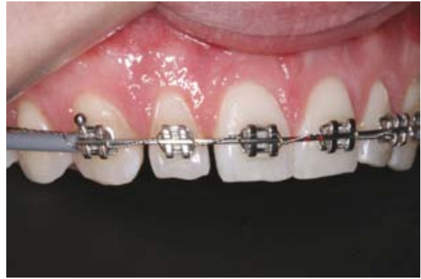
Figura 3B - Pormenor lateral demonstrando a distribuição do espaço, assim permitindo o acréscimo de material na distal do incisivo central e mesial do incisivo lateral.