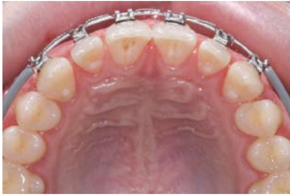
Figura 3A - Foto durante a mecânica ortodôntica. Redistribuição dos espaços para permitir acréscimo de material restaurador de forma uniforme nos dentes.