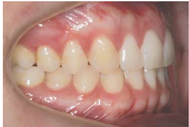
Figura 4B - Pormenor lateral após tratamento ortodôntico e restaurador. Observar a boa relação oclusão mantida e o perfil de emergência das restaurações.