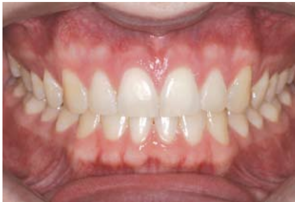
Figura 4A - Realizou-se isolamento absoluto do campo operatório e em seguida, foi feito o condicionamento ácido, e aplicação do adesivo convencional de três passos (Adper ScotchBond Multi-uso (3M/ESPE)). A estratificação da resina composta foi iniciada pela face palatina, na distal dos incisivos centrais, aplicando-se uma resina de esmalte UE1 (Enamel Plus HRi Micerium). Na sequência, foi aplicada uma camada de resina na cor UD2 (Enamel Plus HFO Micerium) e, finalmente, uma camada única de resina UE1 (Enamel Plus HRi Micerium) para esmalte foi aplicada sobre toda a superfície vestibular para proporcionar um contorno adequado. Aspecto das restaurações após o acabamento e polimento final (A).