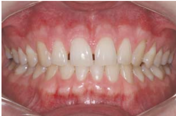
Figura 2A - Observar os diastemas na região antero-superior. Clinicamente, os dentes 12, 21 e 22 apresentavam-se contra-angulados. Além disso, comprovou-se espaços assimétricos (8,5 mm para o 12 e 7,5 mm para o 22). Há discrepância de Bolton de 2,5 mm, com falta de massa dentária na região antero - superior.