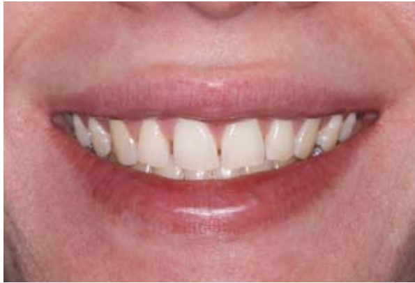
Figura 1A - Aspecto do sorriso inicial. Paciente do gênero masculino com 20 anos e 8 meses procurou atendimento odontológico para solucionar o problema estético causado pelos diastemas dentários anteriores.