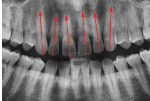
Figura 1B - Radiografia panorâmica aproximada inicial. Notar a angulação dos incisivos.