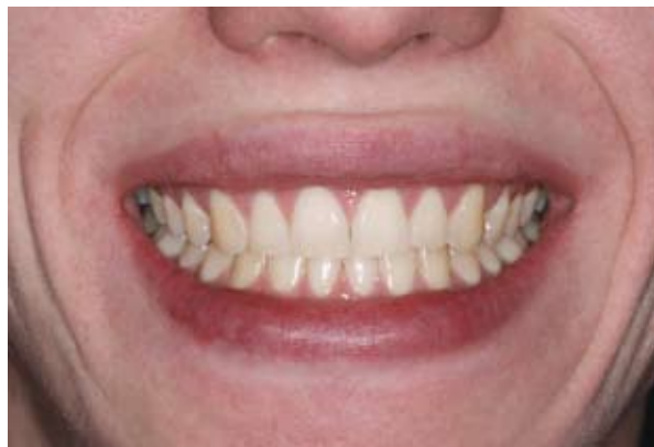
Figura 6B: Aspecto final demonstrando a harmonia do sorriso após o tratamento clínico integrado.