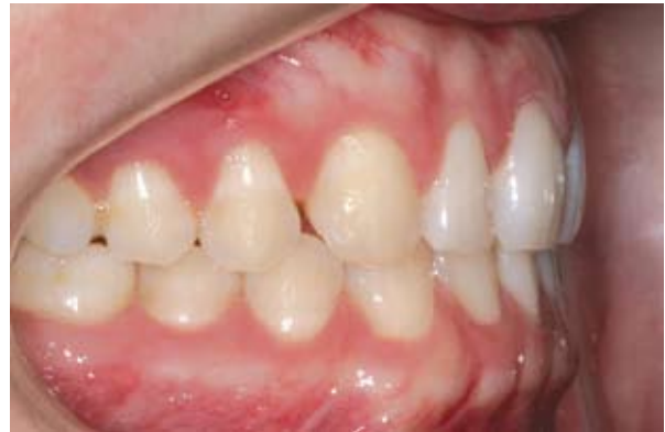
Figura 2B - Foto inicial lateral direita. Após estudo inicial, diagnosticou-se relação dentária Classe I de caninos e molares.