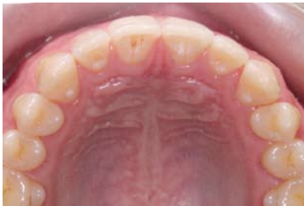
Figura 4C - Vista oclusal final. Notar o contorno incisal das restaurações acompanhando o alinhamento dentário conseguido com o tratamento ortodôntico.