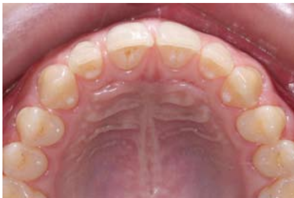
Figura 2C - Vista oclusal inicial. Notar a distribuição desigual dos espaços entre os incisivos.